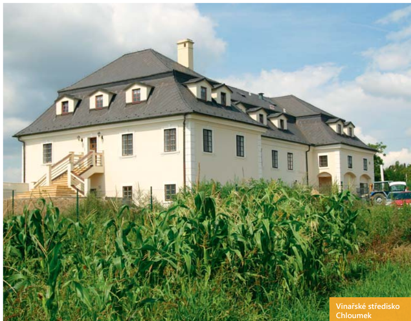
Vinařské středisko Chloumek

sociálním zázemím. Chloumek se stává vyhledávaným zařízením pro konání školení, přednášek a jiných akcí. Malebnost okolní krajiny, romantičnost prostředí starobylé budovy a přítomnost tajemného sklepení dodávají každé konané akci punc výjimečnosti. Při degustaci nelze opomenout zasvěcený výklad správce Bc. Štěpána Weitosche. Na Chloumku vládne vlnná atmosféra a určitou domáckost místa umocňují dva věrní lovečtí psi, které nelze dost dobře nazvat hlídacími, ale spíše vítacími.